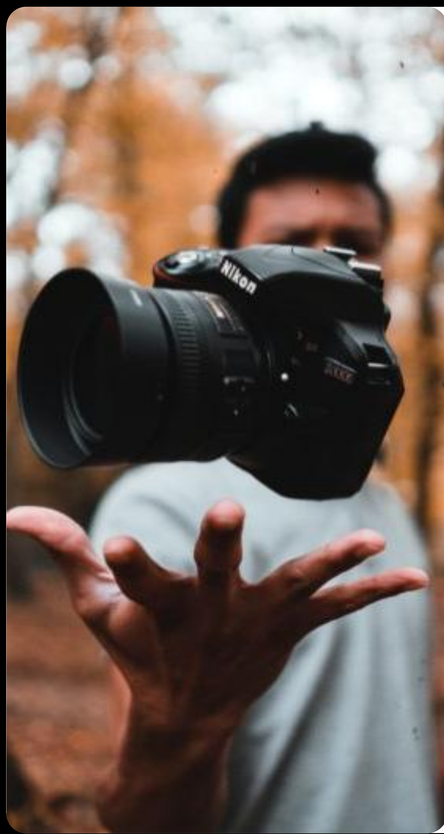
FOTO & FILM

Für die „RICHTIGEN“ Fotos oder auch Filmaufnahmen haben wir ebenfalls die perfekte Lösung!